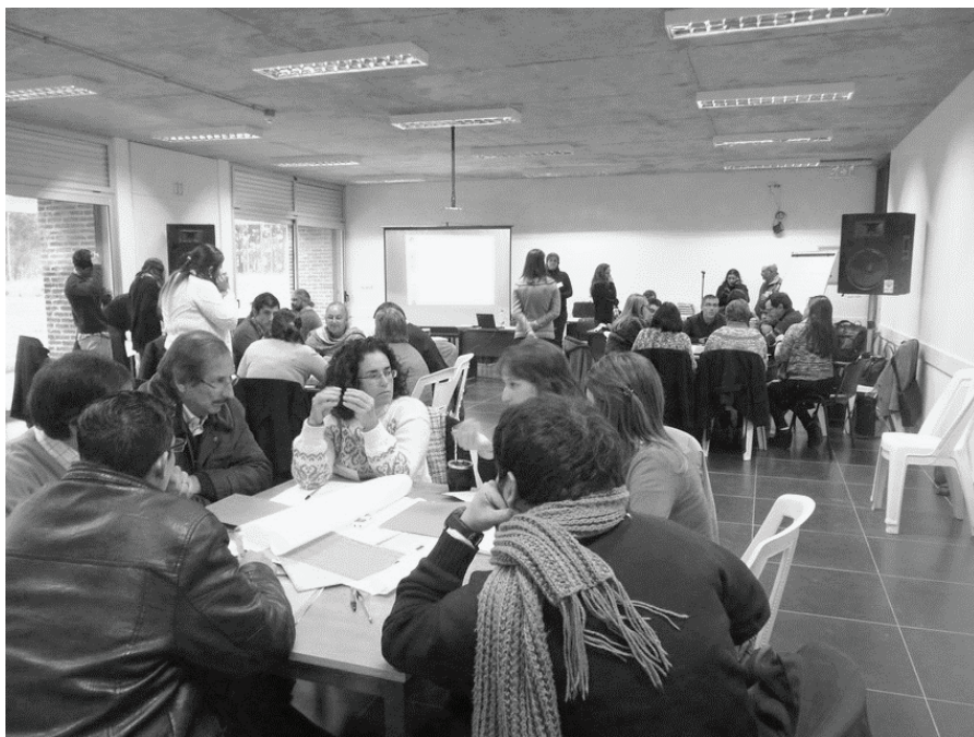
Figura 1 – Instancia del Diálogo Ciudadano, Campus Interinstitucional, Udelar, Sede Tacuarembó, 13 de junio de 2015

El tema general se planteó como El Tacuarembó que deseamos y se definieron los resultados esperados del día: manejar algunas ideas sobre qué aspectos, deseos, esperanzas debemos incorporar cuando pensamos en desarrollo en esta región. La jornada se dividió en tres bloques. Cada uno de ellos implicaba un tiempo de trabajo individual, un tiempo de trabajo colectivo y plenarios generales para compartir lo trabajado con los veinticuatro participantes.